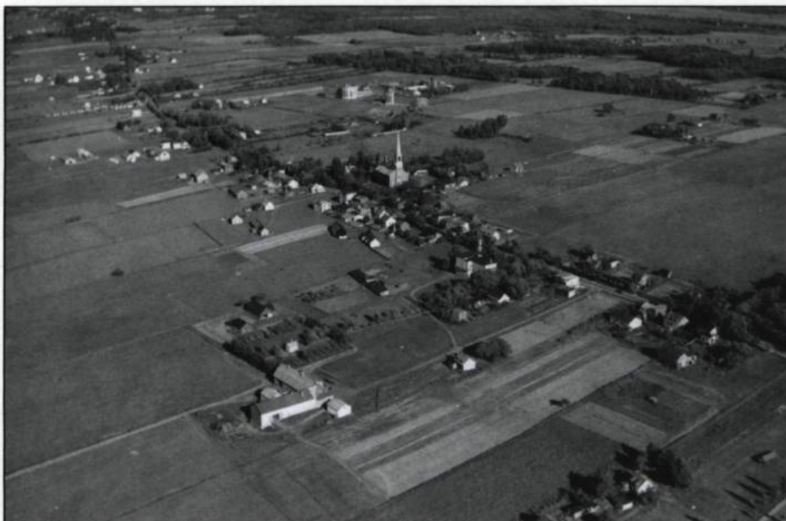
Nous voyons ici le Chemin Sainte-Foy et la future rue de l'église; la vocation agricole des lieux est encore très présente. Cette photographie, prise en 1937, fait partie d'une série visant à couvrir les différents secteurs de la ville. (Collection: Studio Edwards).

Dans les périodes où le travail abonde, les soirs et les fins de semaines sont réservés aux ouvrages de laboratoire, d'agrandissement, de copie de négatifs et de retouche des épreuves. Sa femme, Ella, répond aux clients, prépare les factures mais, progressivement, les tâches familiales l'obligent à se retirer et à consacrer son temps à l'éducation de ses quatre enfants. Ces derniers seront par la suite intégrés à l'entreprise et participeront, selon leurs habiletés naturelles, à la bonne marche de l'entreprise.