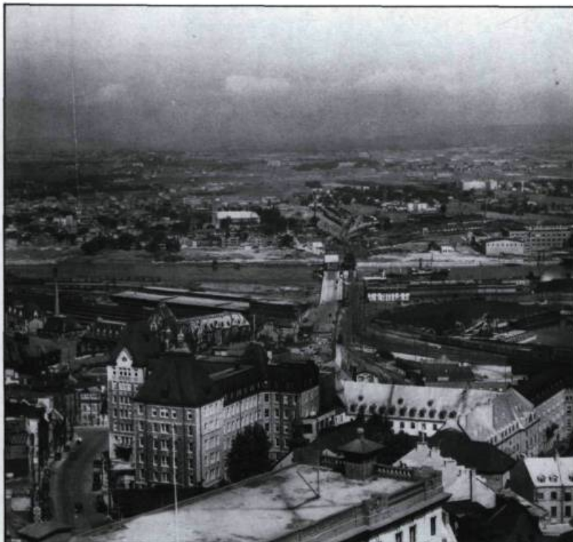
Vue montrant le complexe de l'Hôtel-Dieu vers 1935. À l'arrière-plan, la gare du Palais et la rivière Saint-Charles.

temps inégaux dans la qualité des résultats obtenus. Il ne connut pratiquement pas l'usage des premiers films en couleurs qui n'étaient pas encore au point à leur sortie sur le marché en 1942.