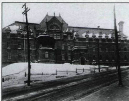
◁ Le pavillon d'Aiguillon avant 1929. Cet immeuble a été construit en 1892 selon les plans de l'architecte Georges-Émile Tanguay et sera démoli en 1959.

En plus d'une chambre noire d'utilisation courante, deux pièces sont aménagées pour le développement et le tirage des panoramas qui requièrent plus d'espace; cette catégorie d'image de grande dimension convient bien aux portraits de groupes rassemblés lors d'événements spéciaux. Malgré les innovations techniques qui favorisent la pellicule souple et les appareils de type portable, Edwards demeure fidèle à ses caméras et aux négatifs de verre de grand format pendant long-