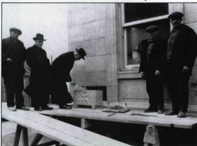
Bénédiction de la pierre angulaire, des ailes Richelieu et du Précieux-Sang, le 10 décembre 1930.