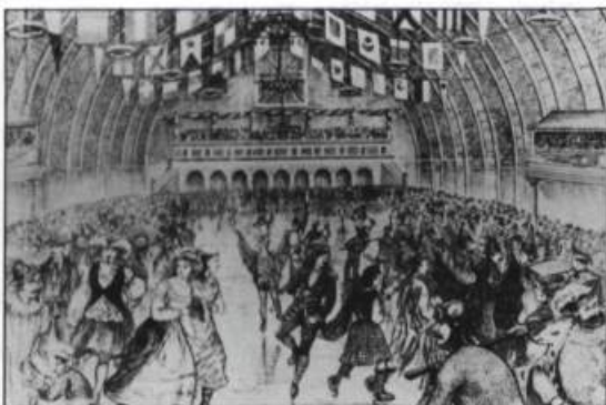
Patinoire couverte située sur la Grande-Allée Gravure d'après un dessin de W.O. Carlisle pour Recollections of Canada, Londres. Chapman et Hall, 1873.