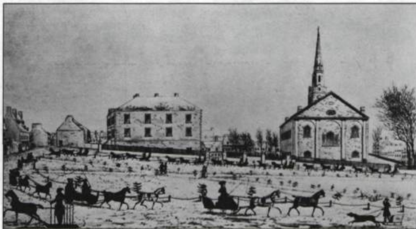
Dès le début du siècle, la carriole canadienne est à l'honneur. Les amateurs, regroupés en association, comme le Quebec Driving Club et le Tandem Club organisent des parades sur la Place d'Armes. Gravure de J. Smillie d'après un dessin de William Wallace D. Smillie & Sons, Québec. 1826.

D'abord sociale, la promenade en traîneau est surtout populaire dans la première moitié du XIX ème siècle. Elle donne l'occasion à ses propriétaires d'afficher chevaux, attelages, carrioles et même l'habillement des passagers.