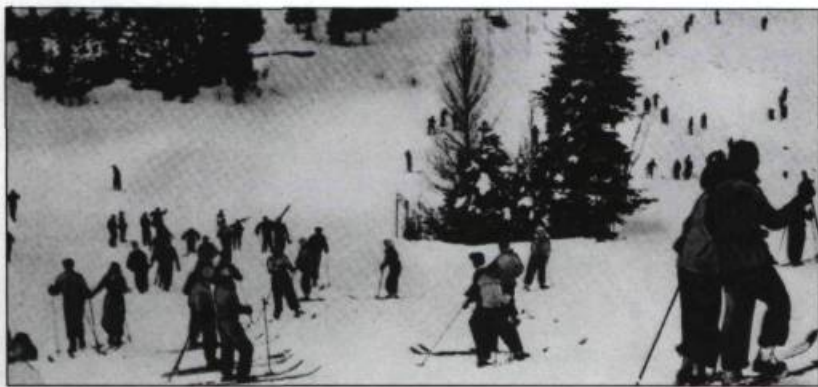
Le Lac Beauport qui célèbre cette année son 50 ième anniversaire, constitue un des sites les plus anciens pour le ski.

À compter du début du siècle, les Plaines d'Abraham commencent à attirer des adeptes du ski. La formation en 1908 du premier club de ski à Québec, suivi par l'Association canadienne de ski amateur onze ans plus tard, confirment l'intérêt grandissant pour ce sport. ♦