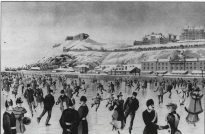
Le fleuve offrait un espace de prédilection pour les patineurs. 1896.

L'existence du patin sur glace est confirmée dès le XIV ème siècle en Europe. Au pays, cette activité se pratique de façon libre ou encore sous forme de compétitions de patinage artistique et de bals costumés comme à l'occasion du Carnaval de 1894. Ce sport nécessite beaucoup d'habileté et d'équilibre.