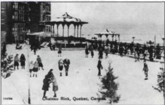
La patinoire située derrière le Château Frontenac attirait nombre d'amateurs. Carte postale.