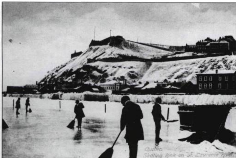
Les balayeurs préparent la glace avant un match de curling sur le fleuve Saint-Laurent en face de Québec.