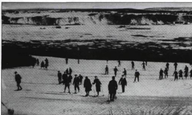
Au printemps les skieurs et skieuses de tous âges profitent du site grandiose des Plaines pour s'adonner à leur activité sportive favorite.

Images du sport dans le Canada d'autrefois. p.65.