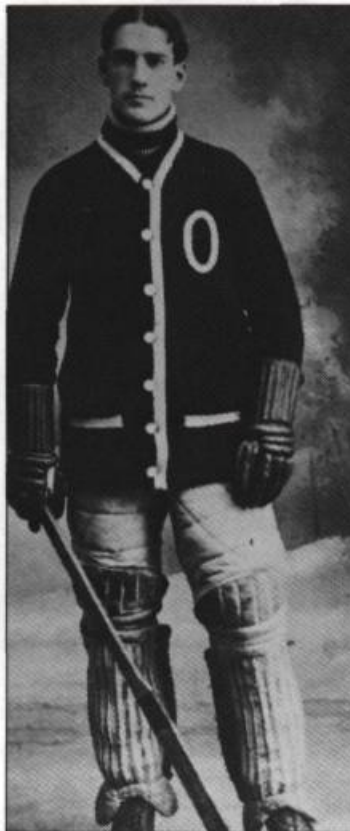
Percy LeSueur, originaire de Québec, était un des joueurs étoiles des Sénateurs d'Ottawa, finalistes pour la Coupe Stanley en 1911.

Ces Bulldogs, arborant le bleu et le blanc, feront partie des premières ligues de hockey professionnel organisées au Canada et, brièvement, de la Ligue Nationale. Ils gagneront la coupe Stanley à deux reprises, en 1912 et en 1913. C'est à l'occasion de cette série de 1913 que seront introduites les lignes bleues.