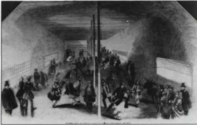
L'intérieur d'un hangar du quai de la Reine aménagé en patinoire intérieure. La tradition veut qu'on la considère comme la plus vieille patinoire couverte au monde. Ballou's Pictorial Drawing Room Companton. 12 janvier 1856