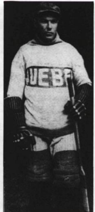
«Paddy» Moran (1877-1966), également originaire de la vieille Capitale, était le cerbère des Bulldogs de Québec qui remportèrent la coupe Stanley en 1912 et 1913.