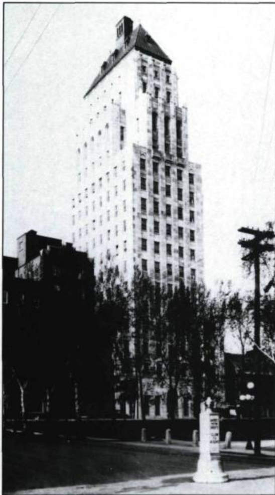
L'édifice Price, «premier gratte-ciel de Québec», est inauguré en 1930. Tiré du journal Le Soleil , 11 décembre 1929. (Archives nationales du Québec, Québec).

François-Xavier Chouinard affirme dans une lettre écrite en 1935 que le permis de construction a été octroyé en novembre ou décembre 1928, au moment où, en raison d'une querelle avec le Conseil municipal au sujet de son mandat, la Commission n'était pas en possession de tous ses pouvoirs. Chouinard s'explique en ces termes: « Quand la Commission reprit son activité, en vertu du règlement 115B, Price House était déjà en construction malgré qu'à ma connaissance personnelle les Commissaires se soient fortement objectés à son érection en dedans des vieux murs de fortifications et spécialement le savant historien, Colonel William Wood... Price House tout en étant un enrichissement immobilier et d'une intéressante architecture n'était pas, rue Ste-Anne, à sa place parmi tant de vieux monuments. Coin de la Couronne et St-Joseph ou en un endroit similaire, cet édifice aurait mieux paru, au milieu des grandes bâtisses commerciales. Ainsi donc, la Commission ne peut, en justice, être blâmée pour un acte dont elle n'était pas responsable. »