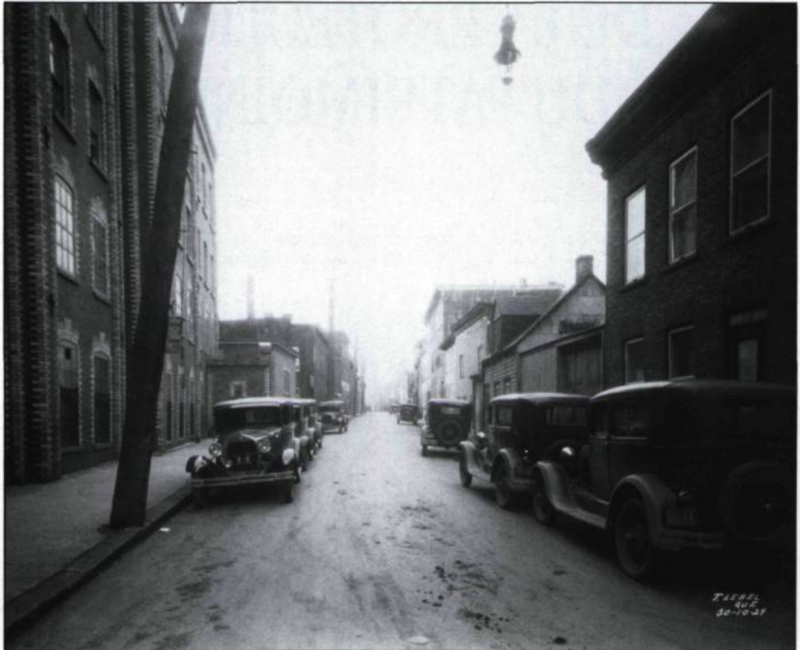
La rue Charest (de Dorchester à Caron avec à gauche la Dominion Corset) avant son élargissement en 1930 pour faciliter la circulation automobile. (Archives de la ville de Québec, Fonds Thaddée-Lebel).

En vue de protéger le caractère historique de la ville, la Commission décide d'abord de s'attaquer à la restauration des vieilles fortifications, en collaboration avec le gouvernement fédéral (projet de 50 000 $), et de rouvrir la promenade en bois qui ceinture la citadelle et rejoint la terrasse Dufferin. La presse s'empresse d'applaudir: « Cette promenade que l'on va rétablir est l'une des plus belles et des plus pittoresques qui soient dans une cité de l'Amérique...Le désappointement d'un grand nombre pour n'avoir pu aller sous les murs de la Citadelle ces années dernières a dû nous faire perdre beaucoup de touristes et par-