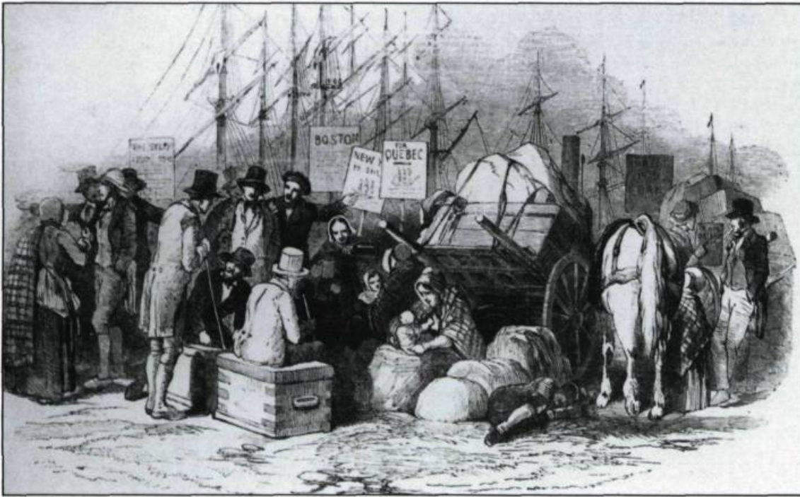
Immigrants attendant le départ de navires pour l'Amérique au port de Cork. Tiré de: The Illustrated London News, 1851. (Archives publiques du Canada).