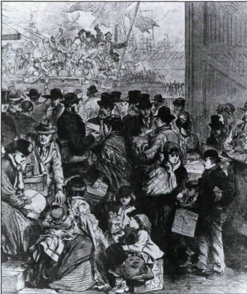
Départ des émigrants pour le Canada. Tiré de: The Canadian Diary, 1862-1872.

De nombreux témoignages d'époque et des études historiques font état des conditions pénibles de la traversée sur l'Atlantique, entre les ports anglais et irlandais et Québec. Des capitaines de vaisseaux sans scrupules, alliés à des agents recruteurs, entassaient leurs passagers dans des cales insalubres, et les timides règlements britanniques sur le nombre maximum de passagers par navire n'étaient pas respectés. Pas étonnant dans ces conditions que de nombreux cas de décès, voire des épidémies, se soient déclarés à bord.