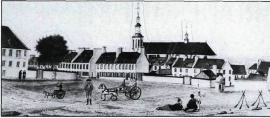
Peintre-topographe de l'armée britannique, Thomas Davies détaille ici les édifices avoisinant le terrain d'exercices militaires. Le style épuré et précis illustre le caractère descriptif utilisé par ces artistes-officiers. Thomas Davies, La Place d'Armes à Québec , 1789. (Musée des Beaux-Arts du Canada, Ottawa).