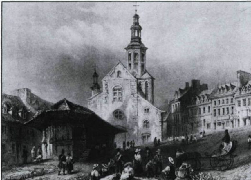
Dans cette autre illustration de la place du marché vers 1830, William Bartlett y confirme son appartenance au mouvement pittoresque. Le traitement des personnages et de l'environnement met en valeur le site en lui donnant un caractère romantique. William Bartlett, «The Market Place» . (Gravure de N.P. Willis, Canadian Scenery Illustrated , Londres, 1842).

Les peintres-topographes qui introduisent cet art au Canada stimulent, par leur habileté et l'abondance de leur production, l'engouement des dilettantes pour l'aquarelle. Parmi ces peintres-topographes de talent, tous hardis voyageurs, quelques aquarellistes féconds nous ont légué des vues de Québec et de ses monu-