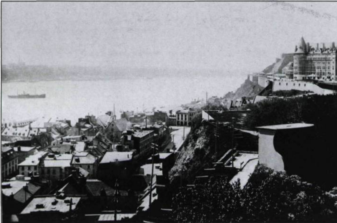
Vue de la basse-ville prise de l'Université Laval vers 1895. On y aperçoit la première aile du Château Frontenac.