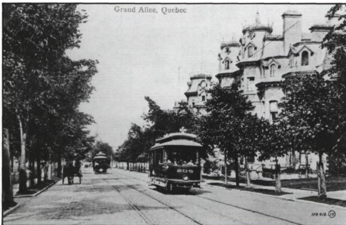
Chars électriques sillonnant la Grande-Allée.

— Tu en es bien loin, ma fille! Tu viens chercher une place de bonne, ajouta-t-elle, visiblement agacée par cette invasion de paysannes