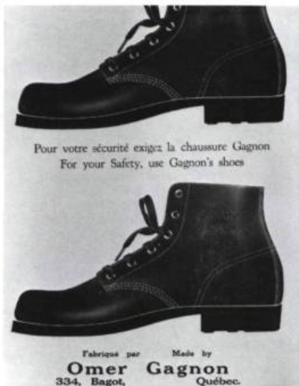
Une publicité d'Omer Gagnon.