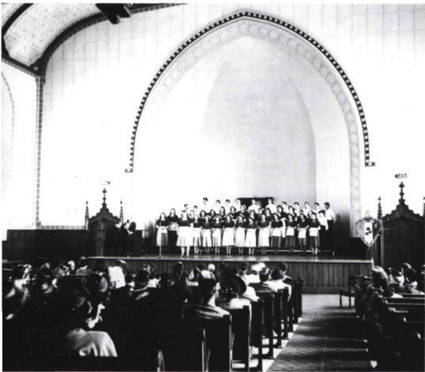
La nouvelle salle de concert et de conférence de l'Institut Canadien telle qu'on la voit en 1948.