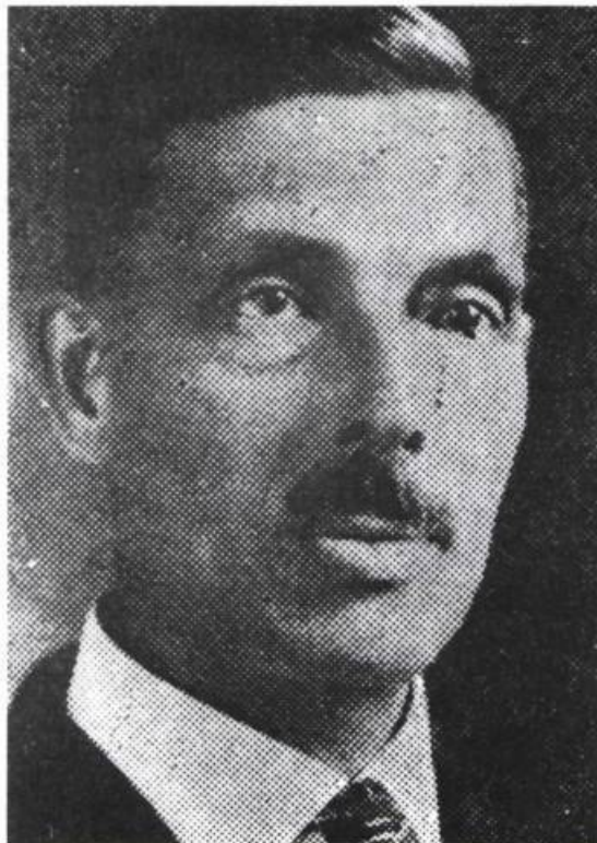
Pierre Beaulé, premier président de la C.T.C.C., de 1921 à 1933

tailleurs de cuir. Ces derniers taillent, bien sûr, les diverses pièces de cuir nécessaires à la fabrication des chaussures. Les machinistes réunissent ces pièces pour former la semelle et l'empaigne. Le monteur, quant à lui, doit réunir l'empaigne à la semelle. Beaucoup d'employés, plus de 50%, ne font pas partie des syndicats: dans la plupart des cas ce sont des femmes. Ils ou elles se consacrent aux travaux de finition (revêtement de cuir ou de tissu à l'intérieur des chaussures, pose des œillets, des lacets, teinture des pièces de