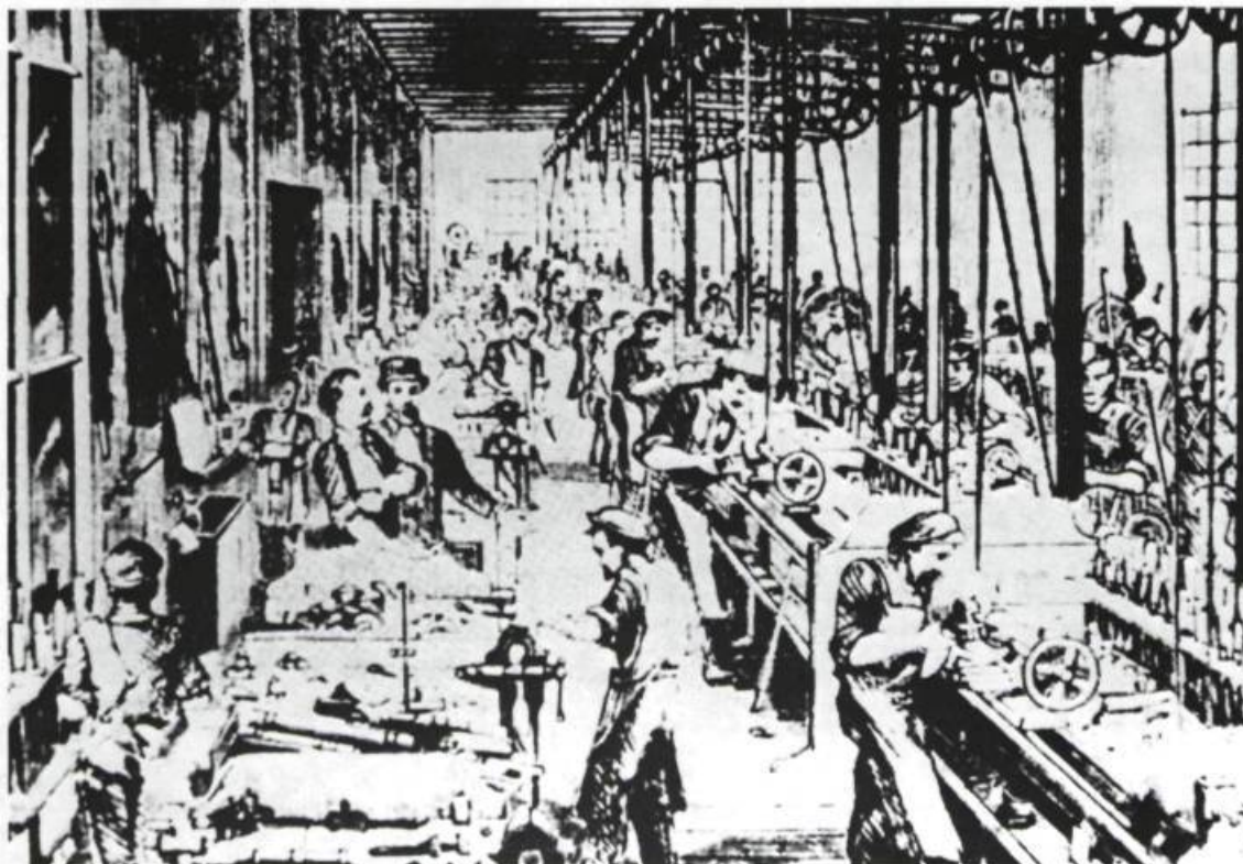
Manufacture de William-A. Marsh.