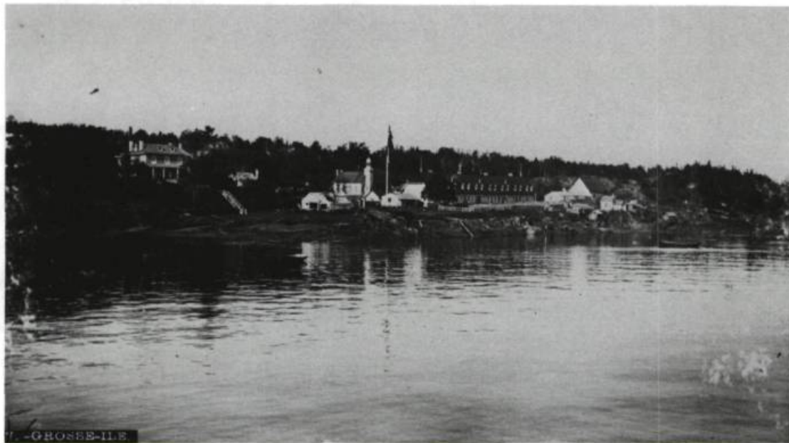
Vue générale de la Grosse Île à la fin du XIX e siècle.

cimetière des immigrants au XIX e siècle.