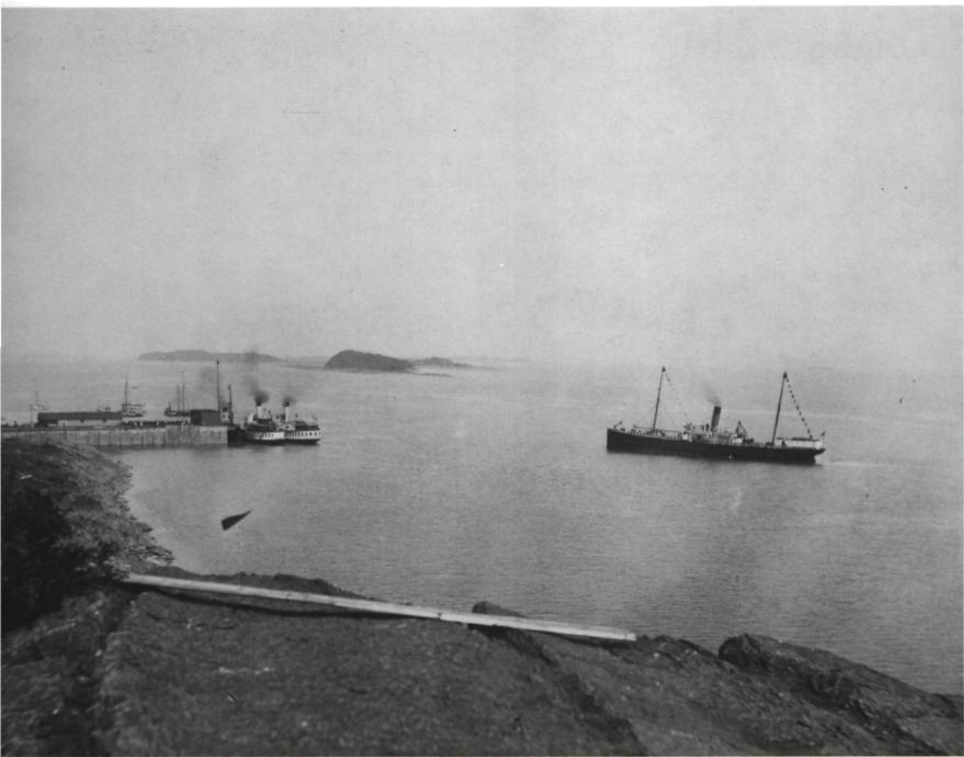
Le quai de Grosse Île.

importante épidémie que Québec n'a jamais connue. Au cours de cet été 1832 plus de 3 500 personnes succomberont à Québec, alors qu'à la Grosse-Île il n'en meurt qu'une trentaine. Le militaire responsable de l'île, le capitaine Reid du 32 e régiment de sa majesté, est complètement débordé. En plus d'être incapable d'obliger les bateaux à arrêter sur l'île, c'est le chaos qui règne; malades et bien-portants sont mélangés et personne ne veut approvisionner les bateaux mis en quarantaine. De plus, la révolte gronde chez les marins et les immigrants, ce qui oblige le capitaine Reid à donner l'ordre à ses soldats de tirer à vue, en cas d'escarmouche. À certains moments, plus de mille personnes se retrouvent en même temps sur l'île et le personnel médical, en nombre insuffisant, n'arrive pas à inspecter tous les bateaux, ce qui cause des délais interminables.