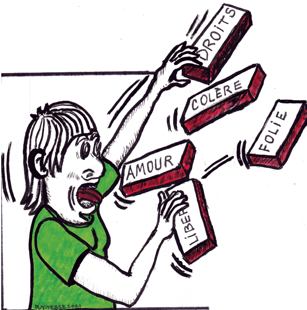
Illustration: Ramon Vitesse.

Il y a de ces préjugés sur ce qu'on conçoit être la «bonne» façon de faire progresser une société. Dans les sphères militantes au Québec, il y a souvent une hiérarchisation implicite des actions à poser et des manières de mener la lutte, qui se cristallise dans ce que j'appelle la figure idéale du «militant de type A». Le militant de type A, c'est souvent un homme. Le militant de type A s'implique 80 heures par semaine, au point de ne pas voir ses enfants, sa famille et les personnes qui lui sont les plus chères. Le militant de type A organise des manifestations à n'en plus finir. Le militant de type A est trop souvent malheureux, parce qu'il n'a pas réellement de qualité de vie: il se consacre corps et âme pour une cause plus grande que lui, espérant voir un renversement des inégalités sociales de son vivant. Le militant de type A ne réalise souvent pas qu'il doit déléguer, qu'un changement social s'opère sur plusieurs décennies, voire plusieurs siècles. Le militant de type A n'a souvent pas conscience qu'il ne fait que mettre une brique à l'édifice du progressisme pour le plus grand nombre, et que c'est déjà beaucoup.