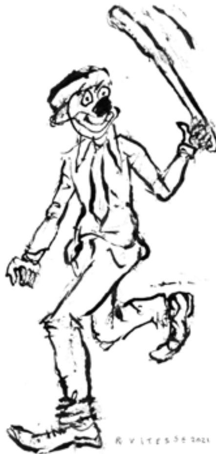
Illustration: Ramon Vitesse.

à Montréal, connaissent une prolifération inquiétante». Dénonçant l'inaction des pouvoirs publics québécois devant le phénomène, le journaliste conclut son texte par une citation de Gilles Gendreau, psychoéducateur et figure historique du champ de la réadaptation des jeunes au Québec, qui soulignait que «c'est maintenant qu'il faut intervenir, si l'on ne veut pas que Montréal connaisse, au cours des 5 ou 10 prochaines années, la même escalade de violence qu'ont connue New York et Los Angeles avec les gangs d'adolescents criminels...».