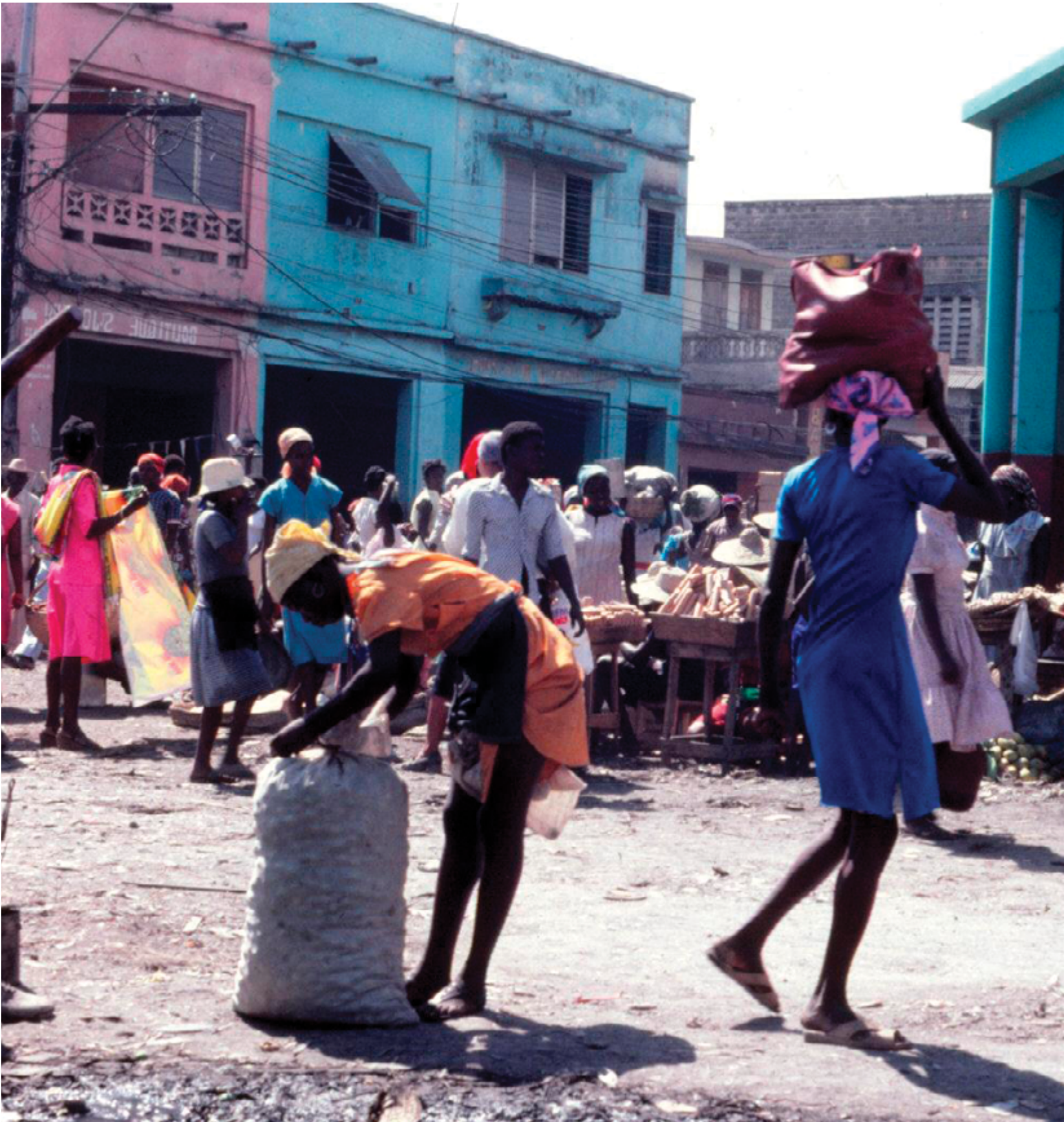
Marché de rue, Port-au-Prince, Haïti.