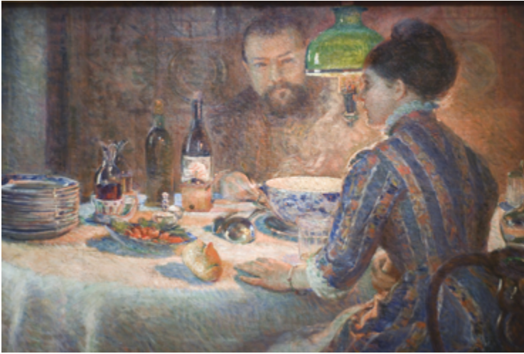
Sous la Lampe , Sisley et sa femme dînant chez les Braquemond à Sèvres. Peinture : Marie Bracquemond, 1877.

Que réservent les changements climatiques à la longévité humaine ? En affectant d'abord les personnes âgées, l'augmentation du nombre d'épisodes de canicule et l'accroissement de la pollution risquent-ils de contribuer à réduire l'espérance de vie ? La réponse à ces questions nous apparaît avec des contours de plus en plus nets.