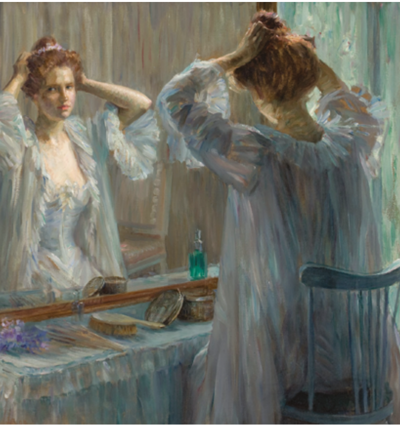
La Toilette. Peinture: Louise Catherine Breslau, 1898.

« Puis c'est là quand on arrête de se réactualiser, quand on arrête de se remettre en question, quand on arrête de suivre le rythme du monde et être actuelle, c'est là qu'on commence à devenir vieux parce qu'on reste figé dans notre temps. »