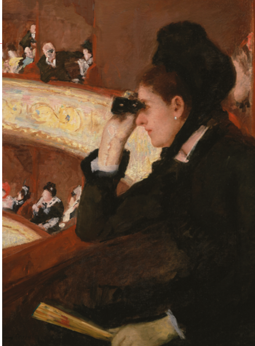
In the Loge. Peinture : Mary Stevenson Cassatt, 1878.

Selon Heinich, les sujets sont en constante recherche de mise en cohérence de ces trois moments. Complétons ce modèle par une dimension intersubjective pour comprendre que le complexe de l'identité d'un sujet se construit aussi et surtout en rentrant en résonance/dissonance et/ou en lutte de reconnaissance avec d'autres sujets qui s'autoperçoivent et se mettent en scène. C'est ainsi que l'âge et les signes de vieillissement des autres sujets en représentation, que ce soit les parents, les collègues du bureau, les sœurs, les tantes, les conjoints, les amants ou les « jeunes filles » du cours de danse influencent le rapport à l'âge de nos participantes.