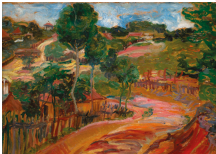
Resnik. Peinture : Nadežda Petrović, 1905.

En effet, comme les problèmes (et solutions) concernant l'intégration sociale des personnes vieillissantes ne peuvent plus être pensés hors de la certitude de l'effondrement, l'époque actuelle représente une opportunité immense pour repenser les relations