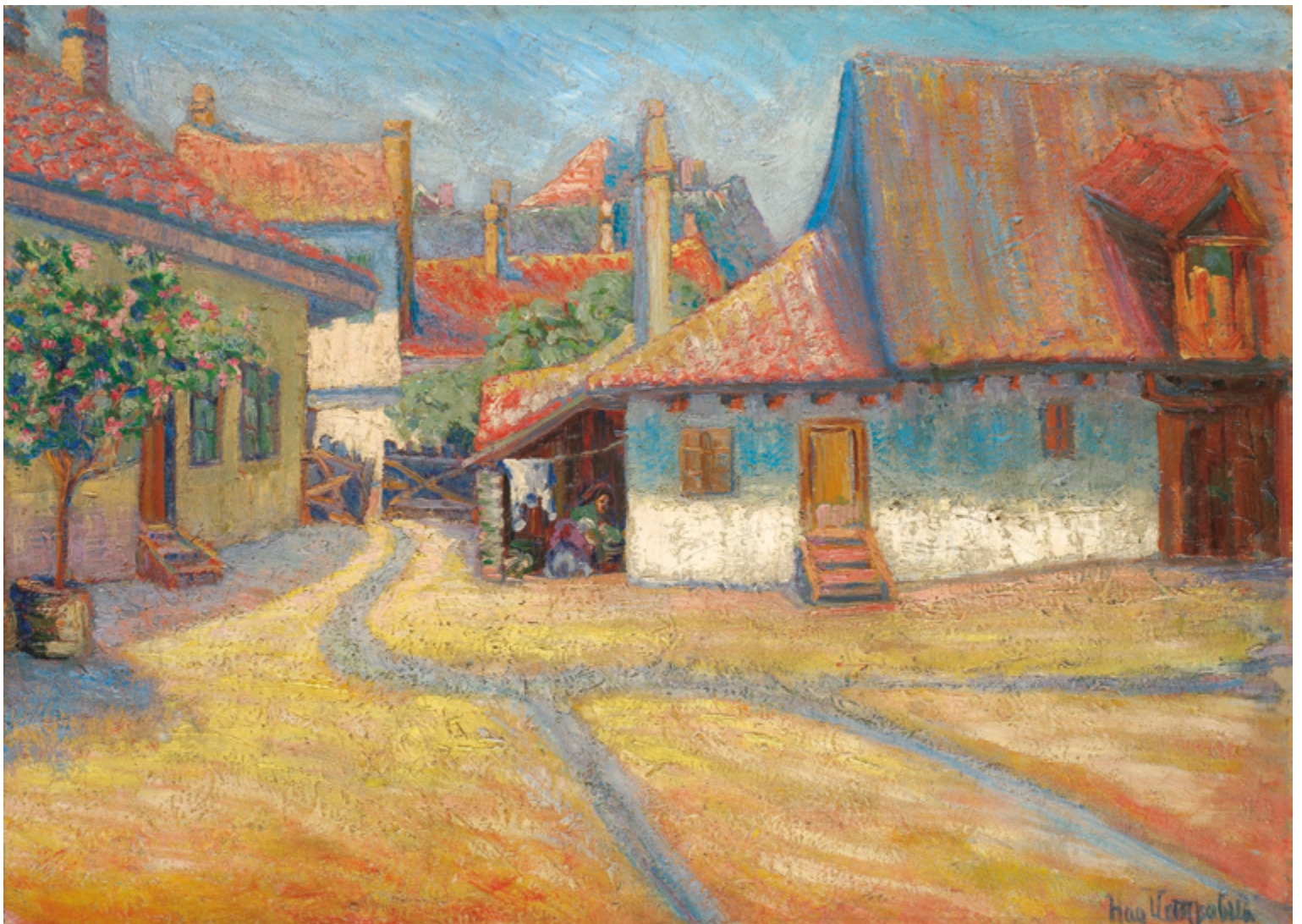
Belgrade Suburb. Peinture : Nadežda Petrović, 1908.

Comme je l'ai également documenté sur le terrain, plusieurs propriétaires n'hésitent pas à employer la maltraitance financière et psychologique pour parvenir à expulser des locataires vieillissant·e·s, en ayant ou non recours aux mécanismes légaux permettant la reprise et l'éviction. Ce climat d'intimidation et de violence, qui se déploie majoritairement dans la sphère privée et donc hors du regard public, décourage les locataires âgé·e·s à invoquer l'article 1959.1 dans de longues et éreintantes procédures à la Régie du logement. Notons qu'entre juin 2016 et février 2019, seulement 17 cas de reprise de possession à la Régie du logement furent contrecarrés grâce à l'article 1959.1 5 . Une fois expulsé·e·s, où ces locataires vieillissant·e·s pourront-ils se loger? À Montréal, selon les chiffres du recensement de 2016, le revenu annuel médian après impôt des personnes âgées de 65 ans et plus, tous genres