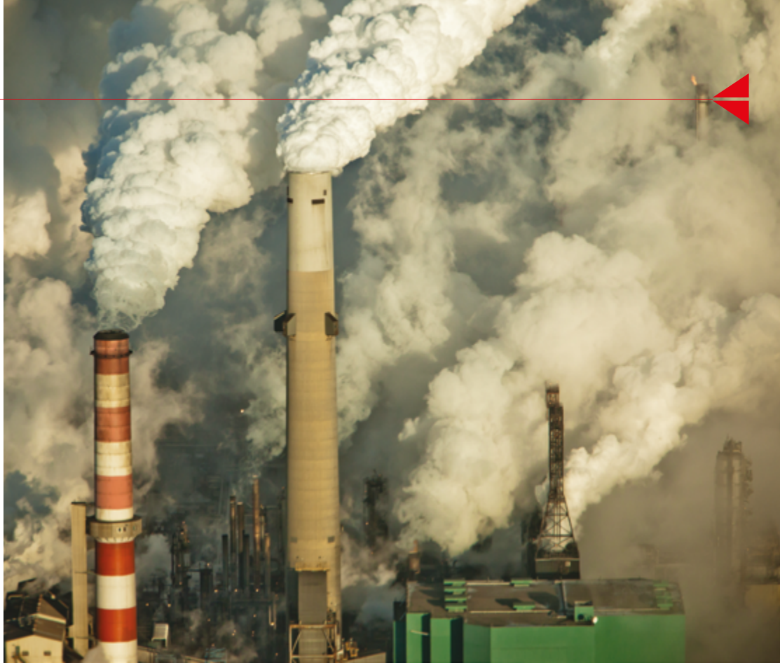
Fort McMurray, Alberta.

Nous, les progressistes albertain-e-s, souhaitons voir l'Alberta se renouveler en étant créative, en changeant les manières de faire et de penser l'économie. Comme vous, nous souhaitons les investissements éthiques en matière de finance et le démantèlement des structures néolibérales toxiques, injustes et inefficaces. Nous souhaitons voir notre province devenir une cheffe de file de la transition énergétique parce que, face à l'urgence, il faut des spécialistes. Or, la population albertaine en comprend; les technologies développées dans les universités d'ici pourraient changer la donne, améliorer la vie, remplacer le fossile par le solaire 2 .