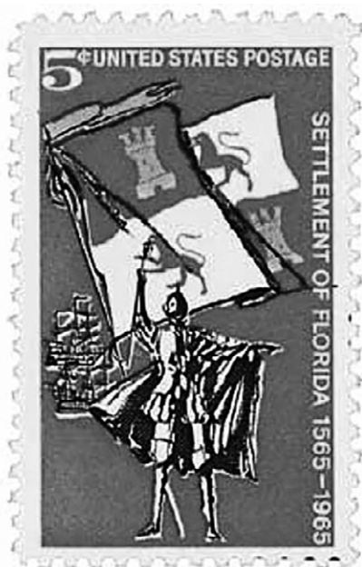
Timbre-poste américain de 5 ¢ commémorant les 400 ans de la colonisation de la Floride. Illustration du United States Post Office Department (1965).