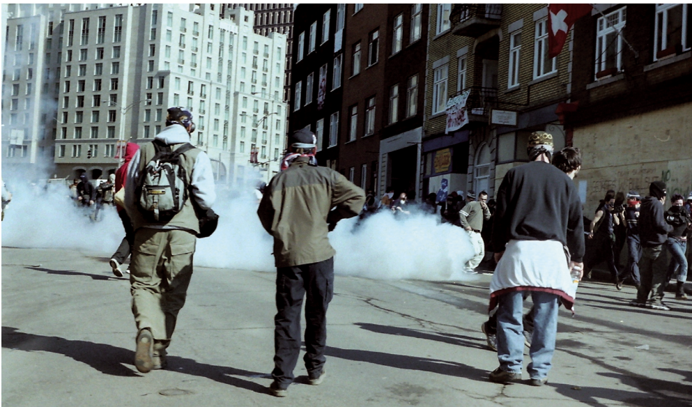
Sommet des Amériques de Québec, 2001.

B. G. : Le Sommet de Québec a cristallisé les luttes autour de l'enjeu démocratique: qui nous représente? Qui prend les décisions sur les enjeux transnationaux qui nous affectent? Les gouvernements des Amériques avaient concocté en secret, sous l'impulsion de grandes entreprises, un immense accord commercial qui permettait de marchandiser des secteurs importants de l'économie. En avril 2001, des dizaines de milliers de personnes se sont réunies à Québec pour affirmer la souveraineté du peuple, dénoncer des politiques élaborées par des responsables étatiques qui se cachaient du peuple, derrière des forces policières. Il s'agissait à la fois de dénoncer et de proposer des alternatives.