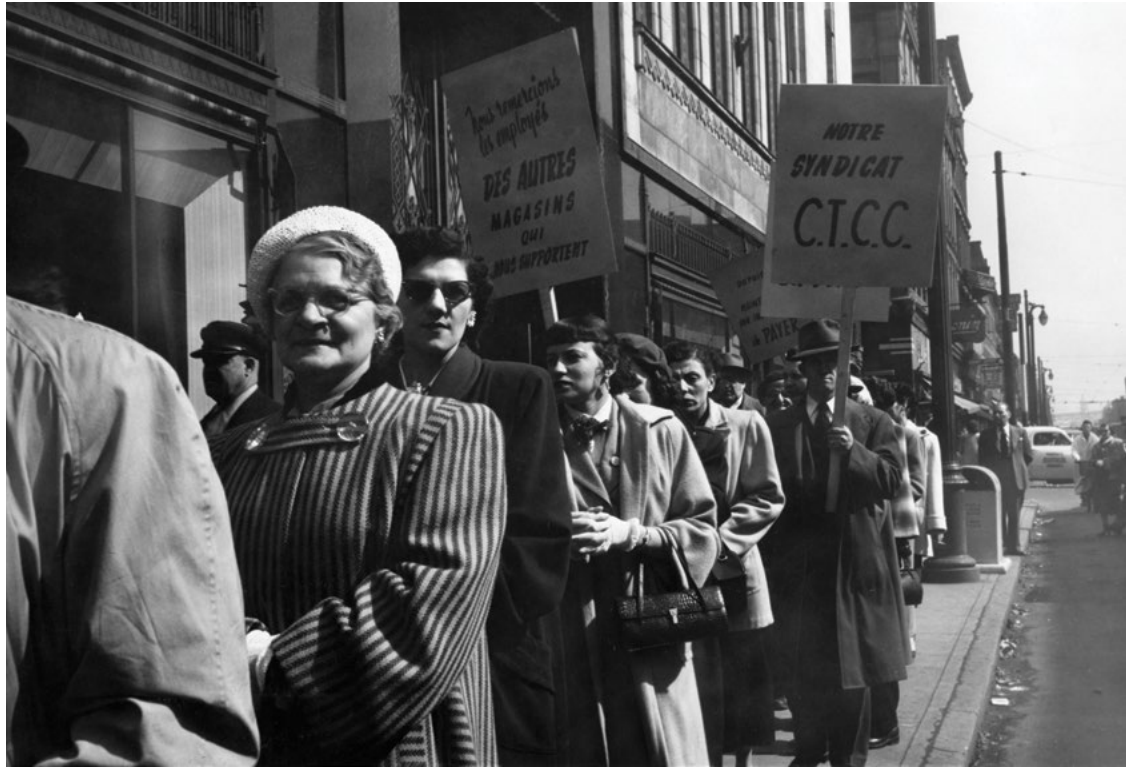
La grève du grand magasin Dupuis Frères, 1952, Montréal.

Le Conseil central du Montréal métropolitain – CSN (CCMM-CSN) est reconnu comme une organisation syndicale militante, combative et solidaire, toujours présente au cœur des luttes politiques et sociales. Son influence sur la vie politique montréalaise et québécoise au cours du XX e siècle est indéniable et se poursuit aujourd’hui. Pour souligner son 100 e anniversaire, nous proposons un rapide survol de son histoire 1 .