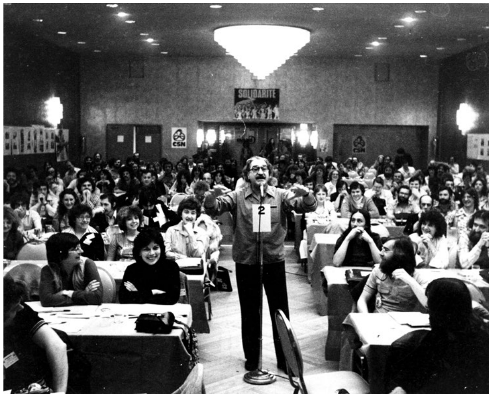
Michel Chartrand au 21 e congrès de la Conseil central de Montréal de la CSN, 1979.

travail reste à faire, ces luttes, menées avec ses partenaires des forces progressistes, ont produit de grandes avancées bénéficiant aujourd'hui à l'ensemble de la population québécoise, syndiquée ou non. Pensons à la création du réseau public des services de garde réclamée depuis des années par le Conseil central, ou à la reconnaissance des conjoints de même sexe, un enjeu pour lequel beaucoup d'efforts ont été déployés.